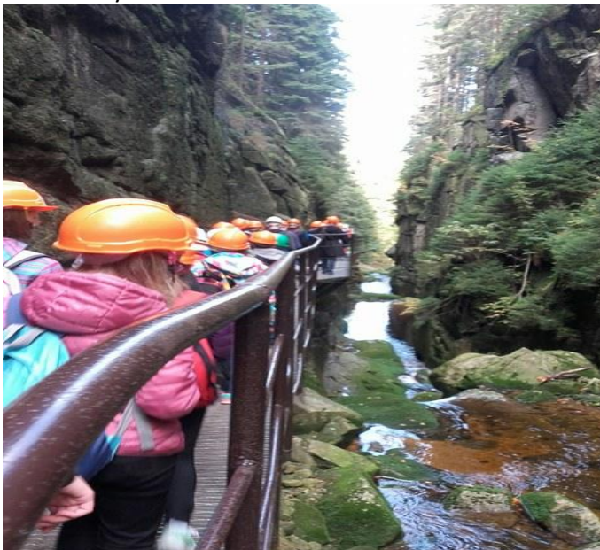
W drodze do Wodospadu Kamieńczyk