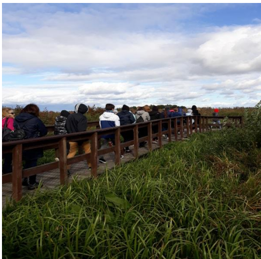
Narwiański Park Narodowy