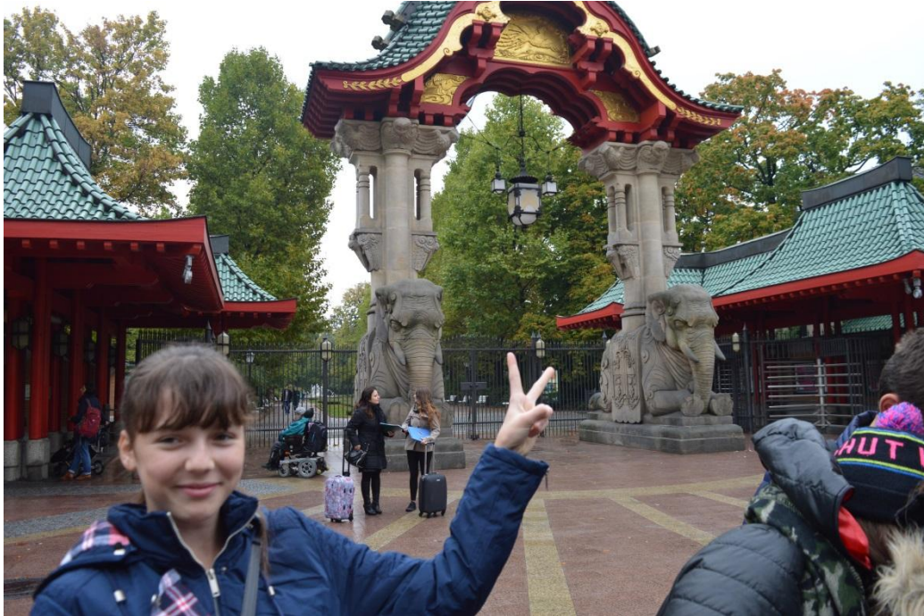
Zoo w Berlinie