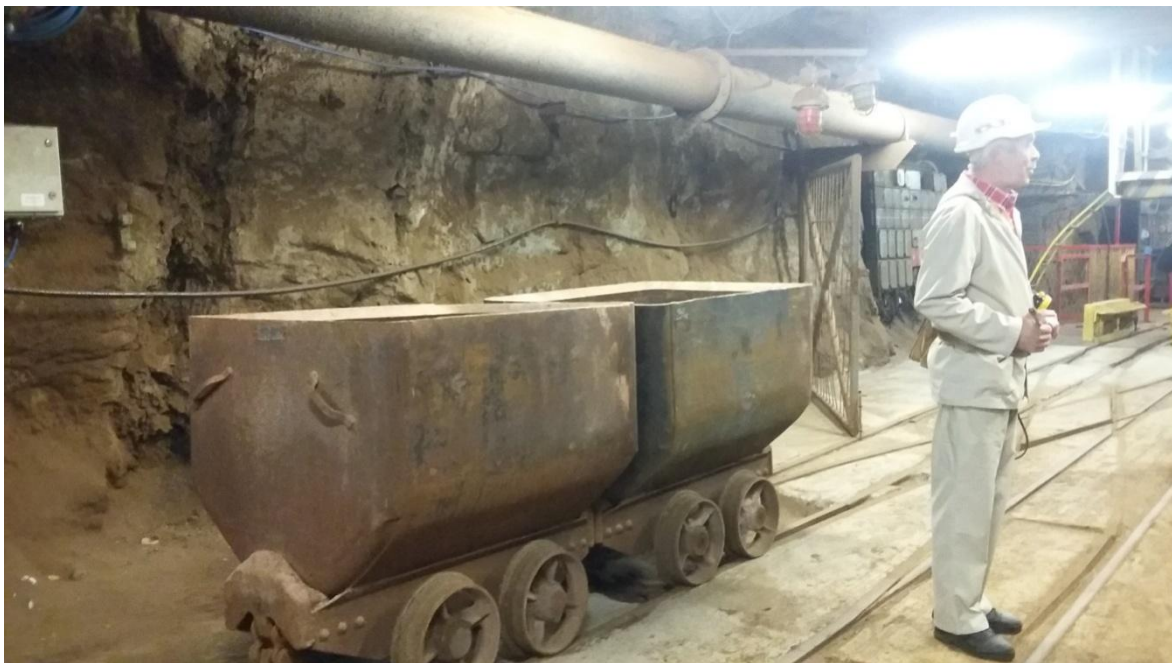
W kopalni soli w Kłodawie