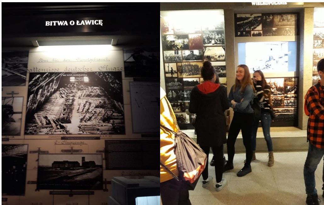
W Muzeum Powstania Wlkp.