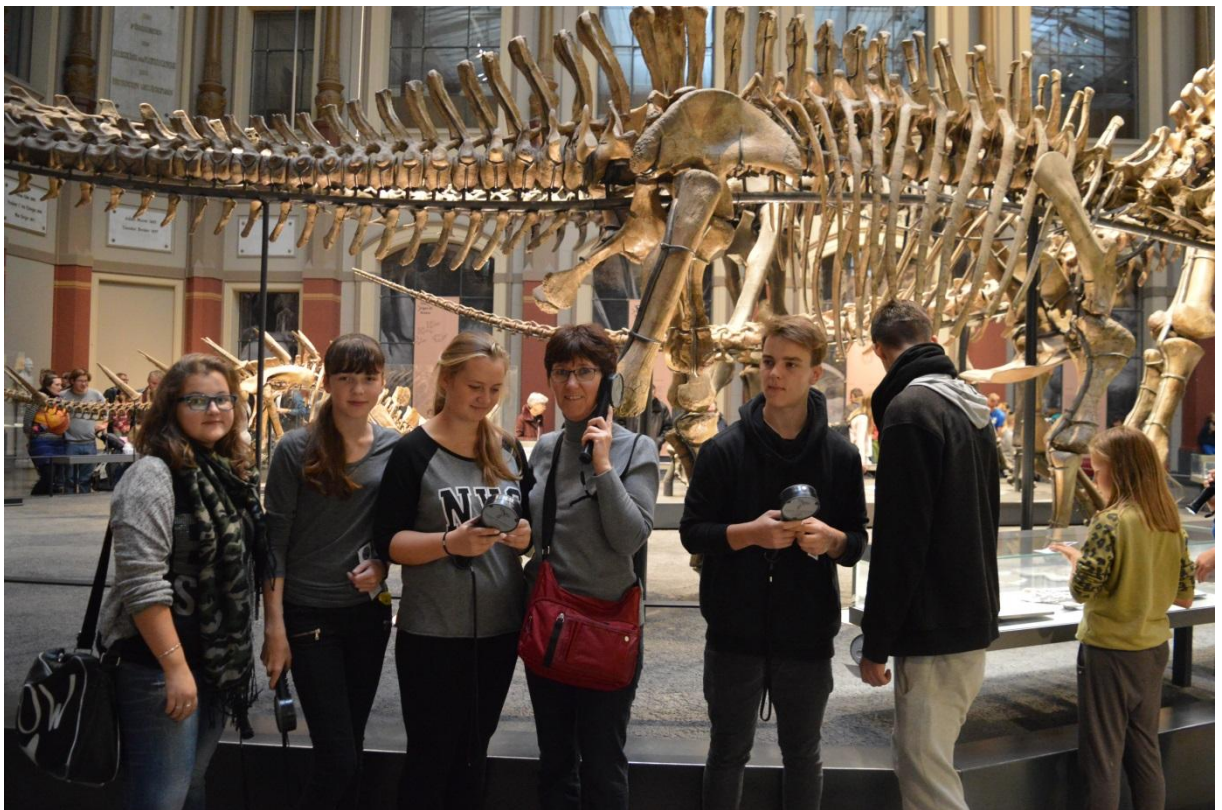
Muzeum Historii Natury w Berlinie