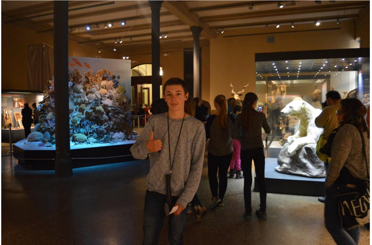
Muzeum Historii Natury w Berlinie