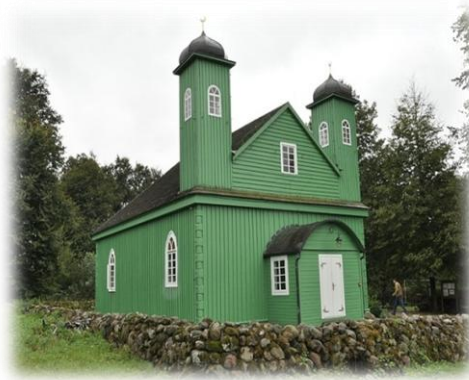
meczet w Kruszynianach