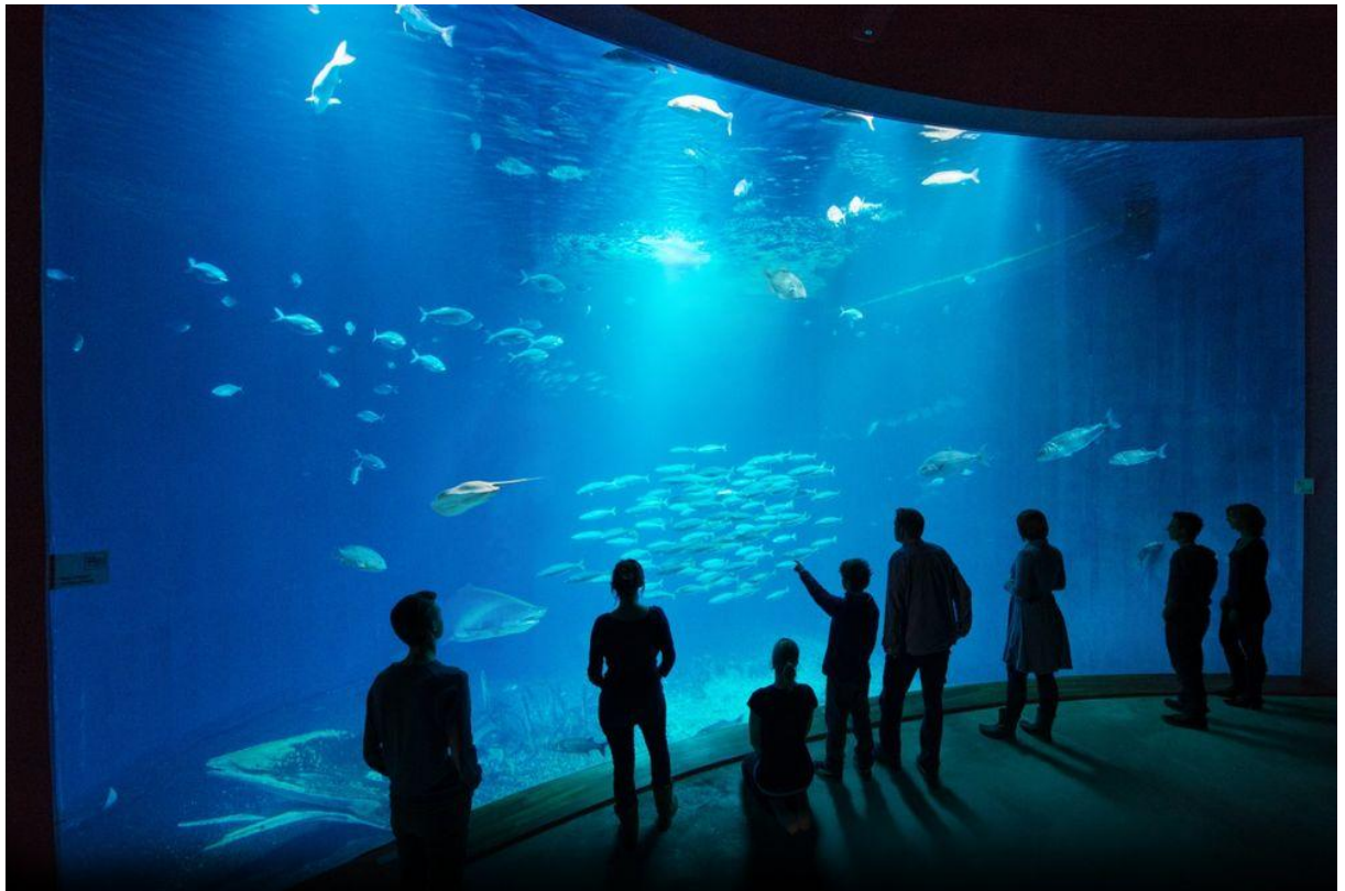
Wizyta w Oceaneum Stralsund Niemcy