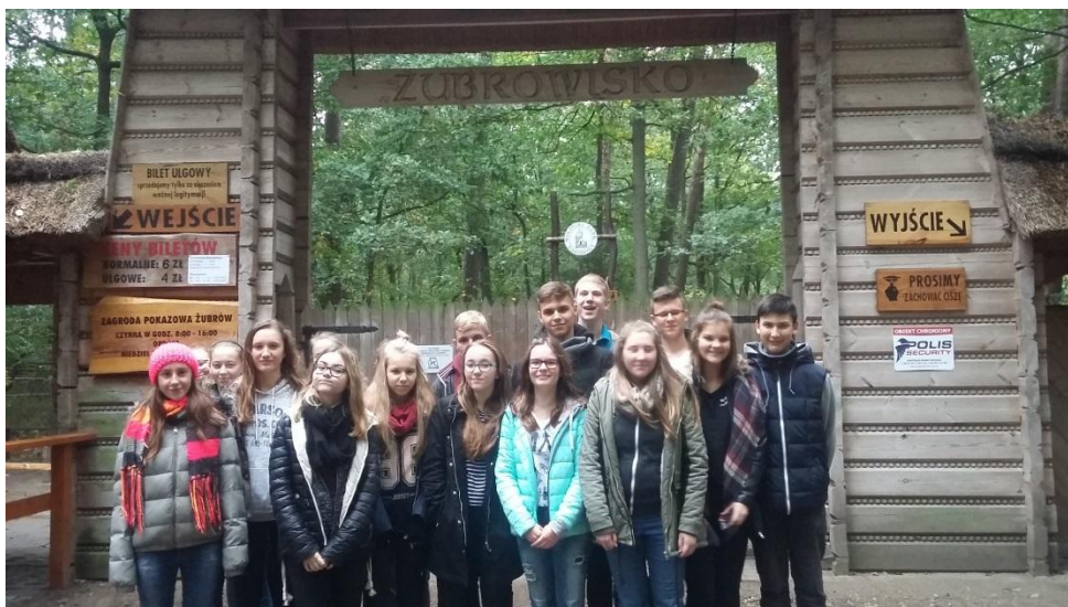
Żubrowisko w Wolińskim Parku Narodowym