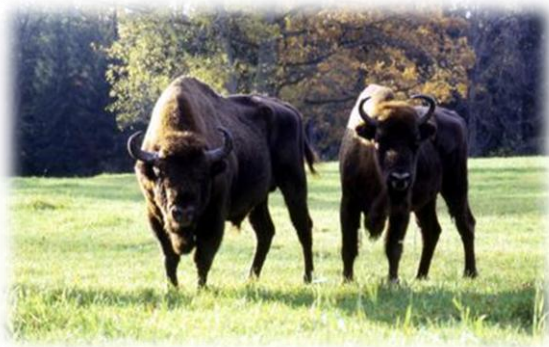
Żubry w Białowieskim Parku Narodowym