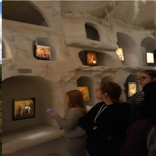
Muzeum Ikon w Supraślu