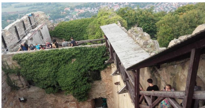
zamek na Chojniku