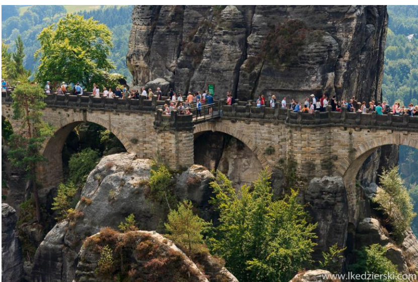
Park Narodowy Bastei w Szwajcarii Saksońskiej