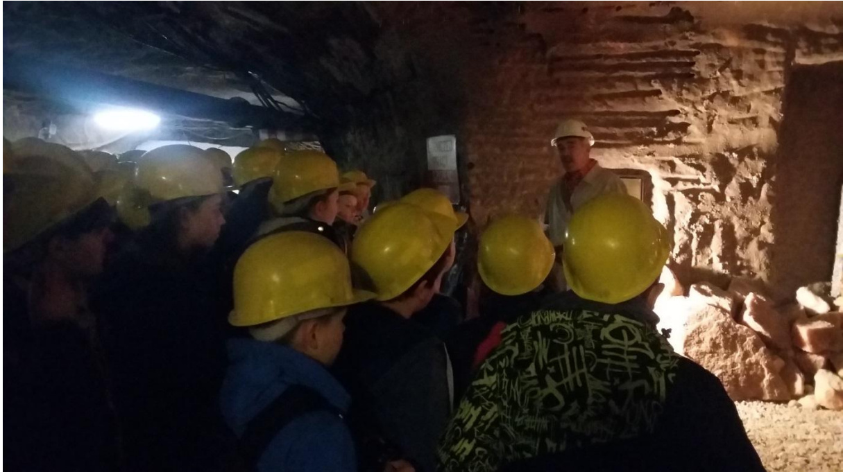
W kopalni soli w Kłodawie