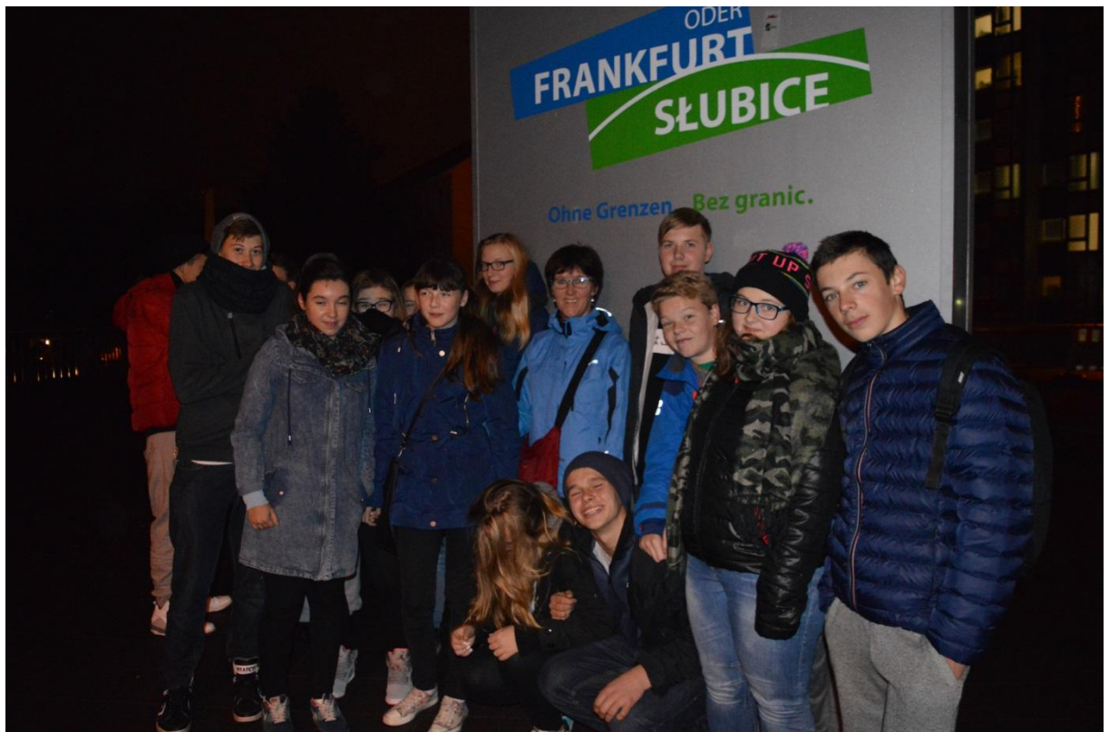
W drodze do Berlina