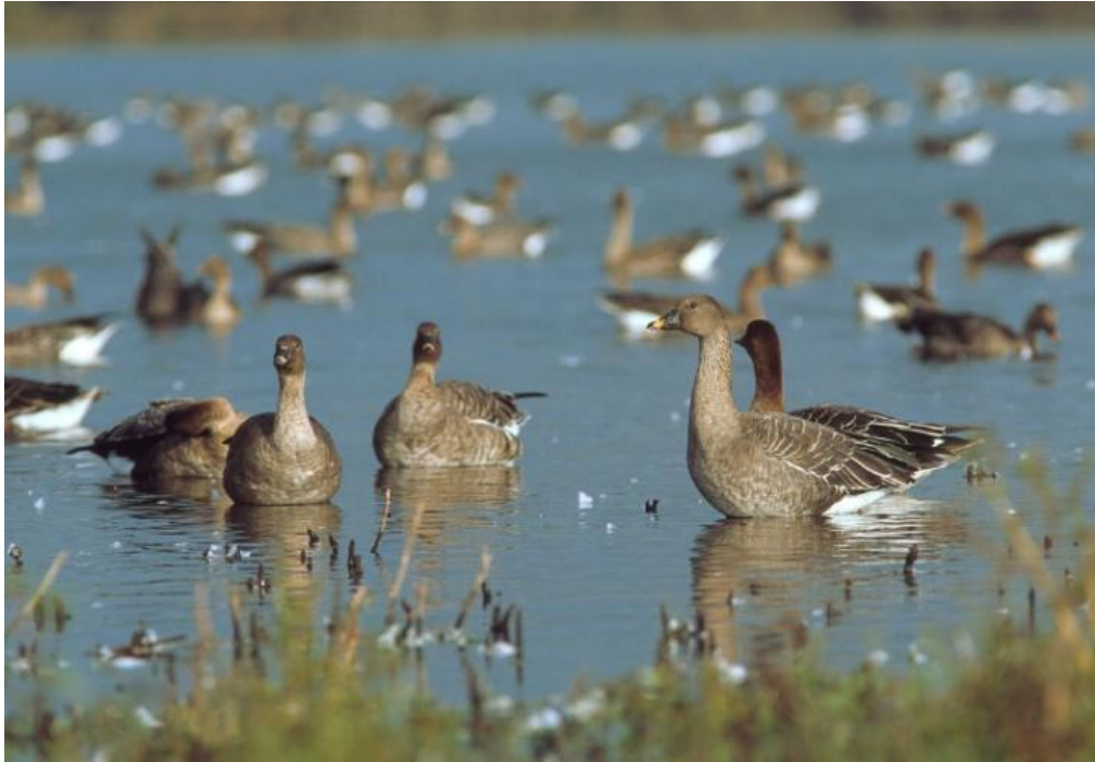
Ptaki w Parku Narodowym Ujście Warty