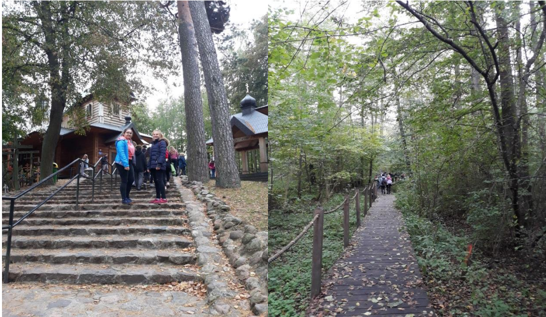
Grabarka ścieżka edukacyjna w Białowieskim PN